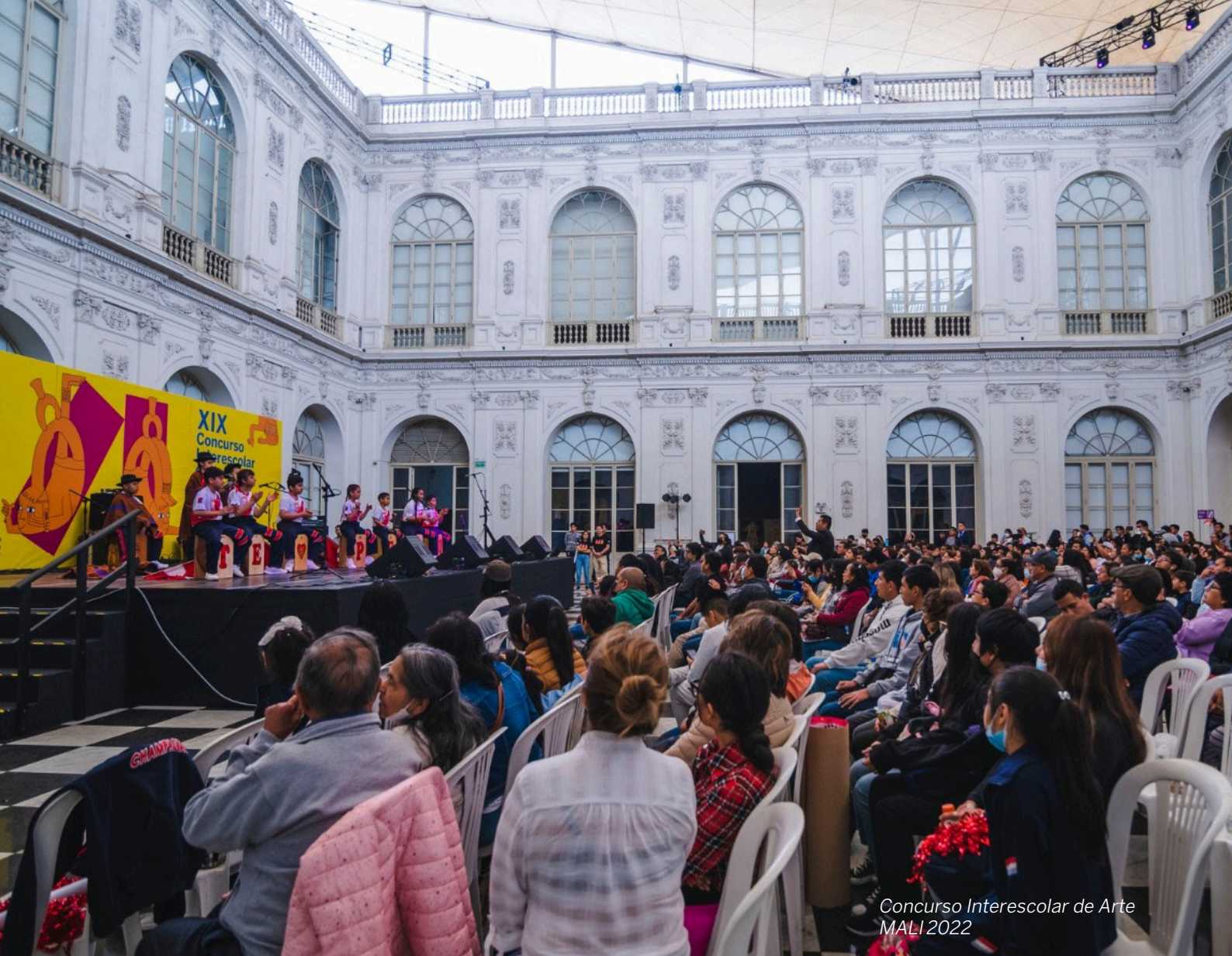
Concurso Interescolar de Arte MALI 2022