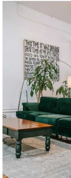
Diseñador de ambientes de casa