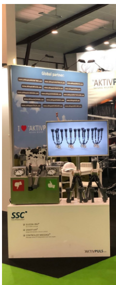
Diseñador de exhibiciones