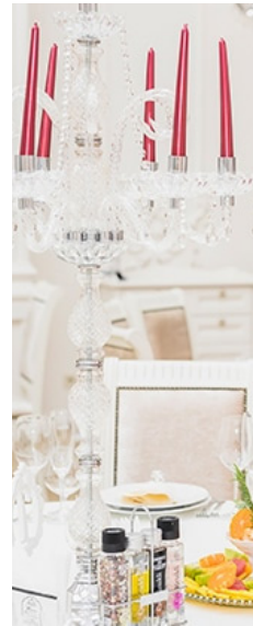
Creativo interiorista para eventos