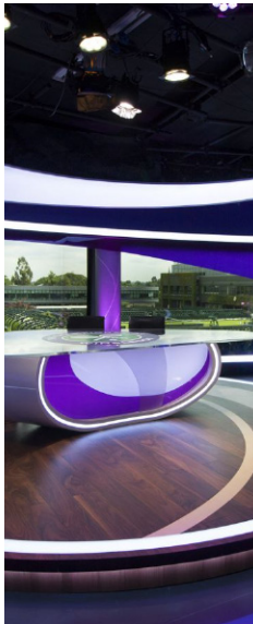
Diseñador de sets