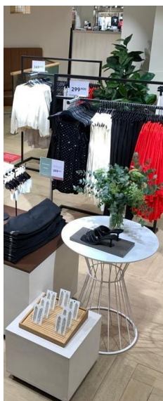
Cordinador visual de tiendas por departamento