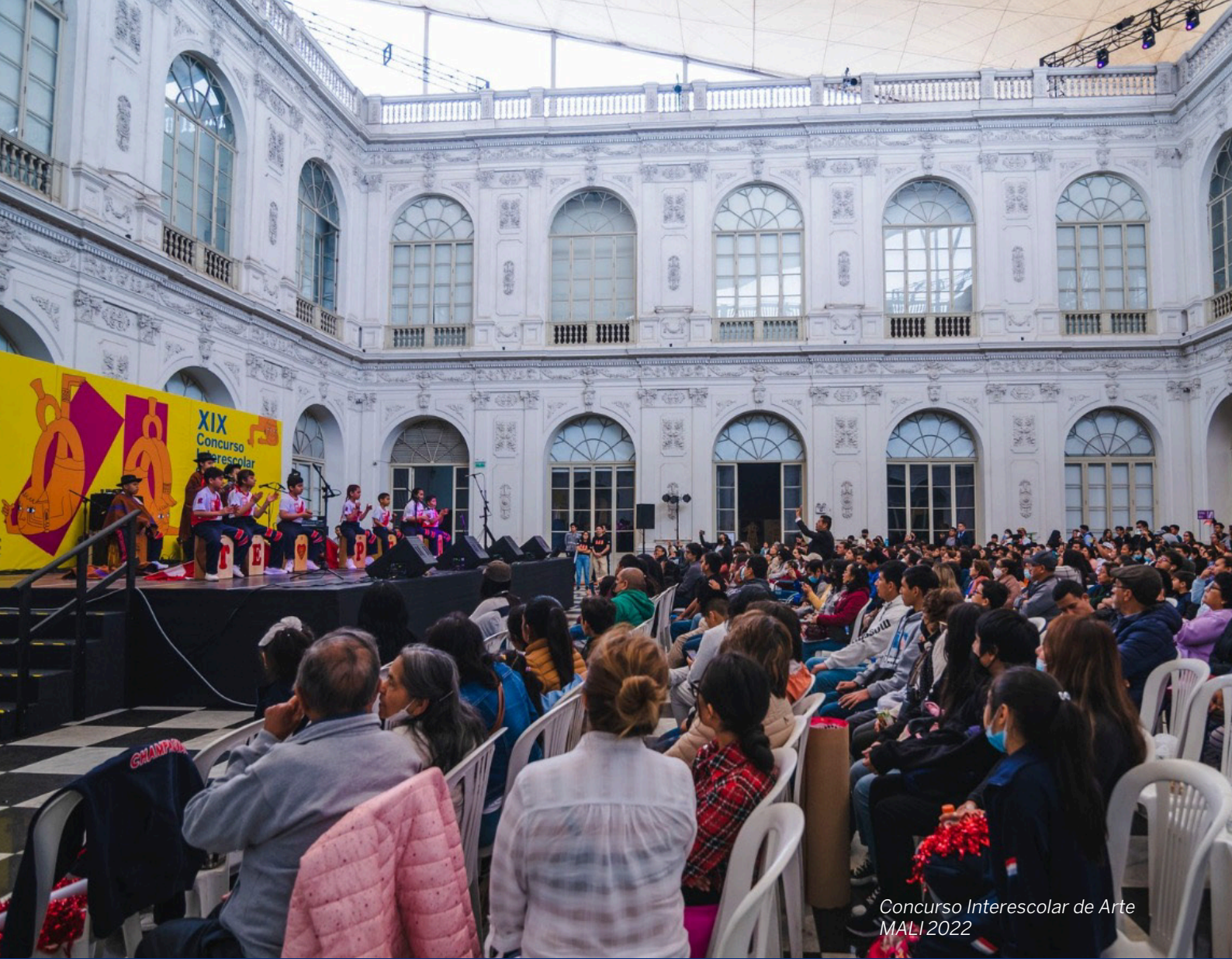
Concurso Interescolar de Arte MALI 2022